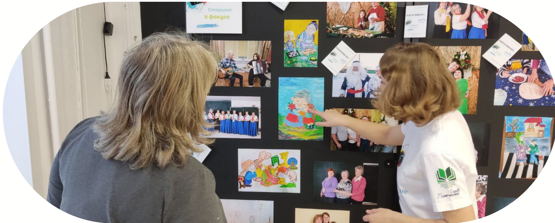
Фото-выставка «Старшие в фокусе»