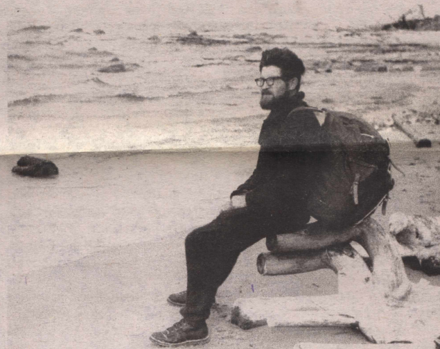
На берегу Белого моря, 1965 год.

Жизнь стремительно меняется. Но, несмотря на смену интересов и приоритетов, книга по-прежнему востребована, а современные технические средства позволяют библиотечным работникам более полно удовлетворять запросы читателей. Компьютеры, Интернет, справочно-правовые системы - всем этим в полной мере владеют