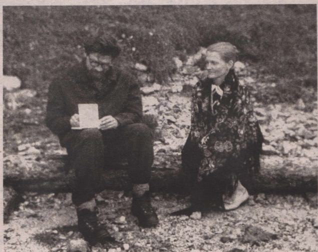
Путешествие по Архангельской области, 1963 год.