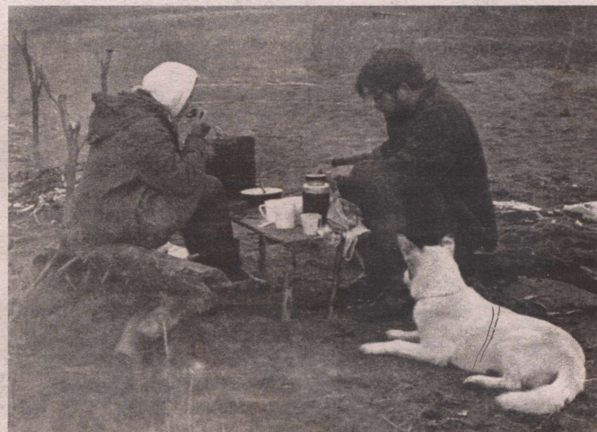
Река Ангара, 1970 год.

Жил легко и трудно. Легко потому, что был добр, не скуп, отзывчив, трудолюбив, он знал, что ему надо